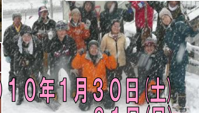
雪かきやったぞー！