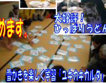
雪かきを楽しく学習「ユキカキカルタ」