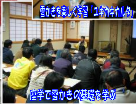
座学で雪かきの基礎を学ぶ