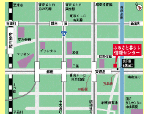
ふるさと回帰支援センター案内map