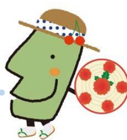
きてけろくん（山形県おもてなし課長）