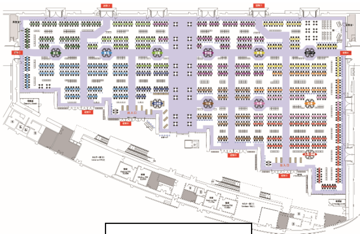
＜ホール E 見本レイアウト＞